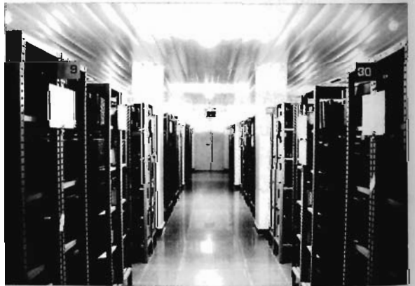
Kho lưu trữ chuyên dụng bảo quản tài liệu Mộc bản triều Nguyễn