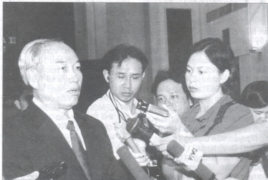
Chủ tịch Quốc hội Nguyễn Văn An trả lời phỏng vấn

quyền ấy của đương sự trong nhiều trường hợp cũng chỉ bằng không. Vì vậy tôi đề nghị sửa điểm b khoản 2 Điều 57 Bộ luật dự thảo như sau: Đương sự có quyền: "Đề nghị Tòa án xác minh thu thập chứng cứ về những tình tiết cụ thể mà tự mình không thể thực hiện được hoặc đề nghị Tòa án triệu tập nhân chứng, trung cầu giám định, định giá tài sản. Tòa án có trách nhiệm đáp ứng các đề nghị đó. Trừ trường hợp đề nghị của đương sự là không có căn cứ hoặc nội dung đề nghị không liên quan đến việc giải quyết vụ án".