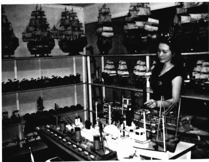
Ảnh Hòa Tân