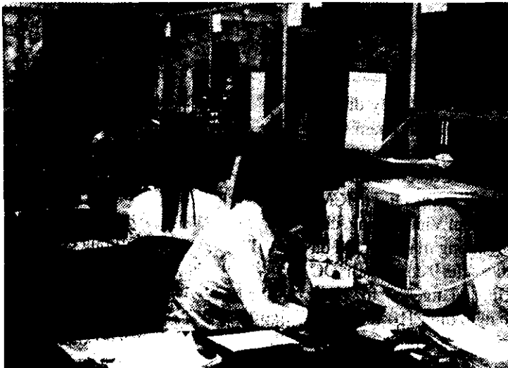
Sở giao dịch Ngân hàng Ngoại thương Hà Nội

Hiện nay, xu thế hội nhập kinh tế quốc tế và tự do hoá thương mại dịch vụ tài chính đang mở ra nhiều cơ hội nhưng cũng đặt các NHTM Việt Nam trước những thách thức không nhỏ. Theo thoả thuận vừa đạt được giữa Việt Nam và Mỹ, quanh vấn đề Việt Nam gia nhập WTO, Việt Nam cam kết sẽ mở cửa khu vực ngân hàng cho các công ty nước ngoài. Do đó, từ sau 2010, các ngân hàng Mỹ sẽ được phép thành lập ngân hàng con 100% vốn Mỹ tại Việt Nam, với điều kiện vốn điều lệ tối thiểu là 10 triệu USD. Ngoài ra, từng ngân hàng nước ngoài sẽ được phép nắm giữ 30% cổ phần tại các ngân hàng của Việt Nam, tăng so với mức quy định 10% hiện nay, các hạn chế đối với hoạt động của các ngân hàng nước ngoài tại Việt Nam cũng dần được dỡ bỏ. Như vậy, để tồn tại và phát triển trong môi trường có nhiều đối thủ cạnh tranh, các NHTM Việt Nam cần kiểm soát được rủi ro, trên cơ sở thực hiện những nguyên tắc cơ bản về giám sát ngân hàng của Ủy ban Basel. Theo đó, để nâng cao chất lượng quản lý tài sản, các ngân hàng phải đạt đến tỷ lệ Cooke. Tỷ lệ này quy định, số tiền cơ bản của một ngân hàng chia cho số tiền cho vay không thấp hơn 8%. (Tỷ lệ này trong các NHTM Việt Nam hiện nay vẫn còn ở mức dưới 5%.) Ngoài quy định tiêu chuẩn về tỷ lệ an toàn vốn tối thiểu, Basel còn khuyến khích các ngân hàng tự quản lý bằng việc áp dụng những phương pháp đánh giá nội bộ về nhu cầu sử dụng vốn, chú ý đến tình trạng rủi ro của ngân hàng trên cơ sở phân tích các yếu tố tác động của thị trường... ♦