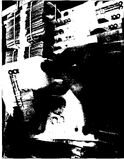
NHTW Trung Quốc vừa quyết định nâng lãi suất ngân hàng lên thêm 0,27% kể từ ngày 15/9.

Nguyên nhân chủ yếu giúp kinh tế Nhật Bản mấy năm gần đây phục hồi là do trong hơn 5 năm cầm quyền ông Junichiro Koizumi đã xoay chuyển được tình thế khó khăn trong 10 năm của thập kỷ 1990, khi mà có tới 9