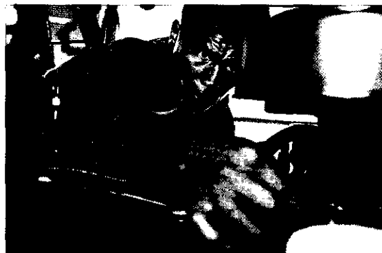
Ấn Độ được dự báo là nước có tốc độ tăng trưởng kinh tế nhanh, dự kiến tăng 8,5% trong tài khoá tính đến hết tháng 3/2008.

Còn tại khu vực châu Phi, mức tăng trưởng kinh tế trong năm sẽ đạt khoảng trên dưới 6%, tuy nhiên khu vực Mỹ-Latinh và Tây Á mức tăng trưởng kinh tế sẽ chậm lại đôi chút, xuống khoảng 5%. ☉