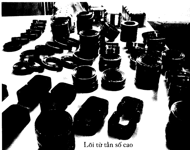
Lỗi từ sản số cao

• Các cán bộ khoa học khi thực hiện Dự án đã sử dụng triệt để tiết kiệm và đúng mục tiêu nguồn kinh phí được đầu tư và đã tạo ra được một PTN chuyên đề, tuy chưa thật hiện đại nhưng đồng bộ để làm ra các sản phẩm từ A đến Z, từ nguyên liệu thô thành các linh kiện điện tử dùng trong nhiều khí tài quân dụng. Tuy nhiên, PTN này